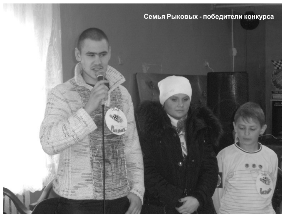
Семья Рыковых - победители конкурса