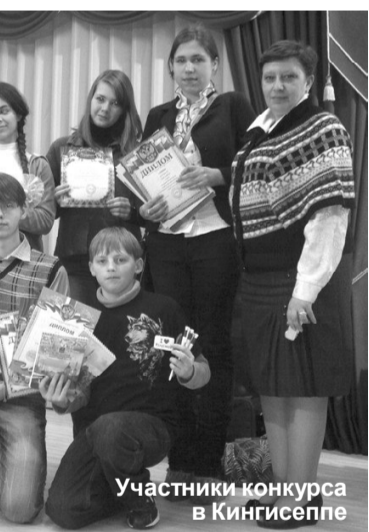
Участники конкурса в Кингисеппе