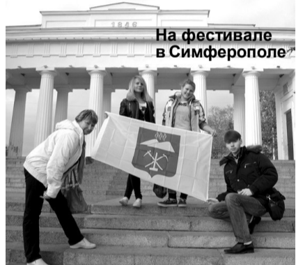
На фестивале в Симферополе

6-9 декабря в городе Симферополь состоялся третий международный фестиваль детского и молодежного игрового кино «Золотой