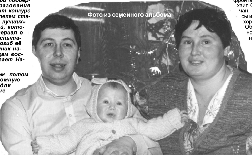
Фото из семейного альбома