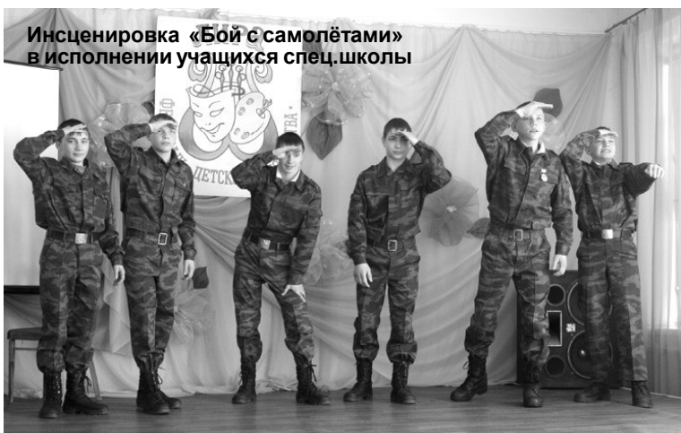
Инсценировка «Бой с самолётами» в исполнении учащихся спец.школы

Фестивальную эстафету у конкурса художественного чтения принял вокальный смотр-конкурс.