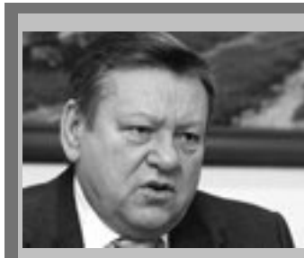
Прозрачный бюджет: что сделано? «Еще не закончился нынешний учебный год, а правительство области уже заботится о том, чтобы все общеобразовательные учреждения были своевременно готовы к следующему».

Над этим мы должны работать в этом и последующих годах. Спасибо за внимание!