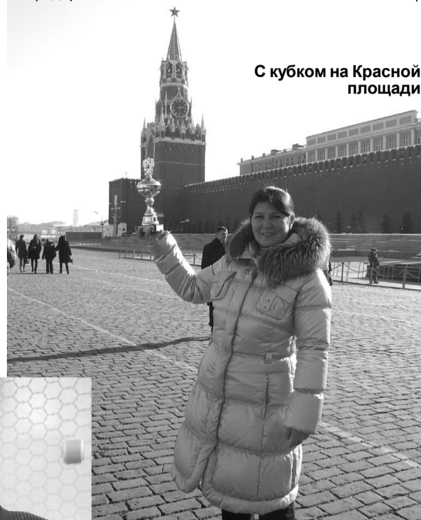
С кубком на Красной площади

пока некому. Поэтому постоянные изменения в законодательстве о предпринимательстве не всегда –