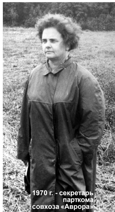
1970 г. – секретарь парткома совхоза «Аврора»