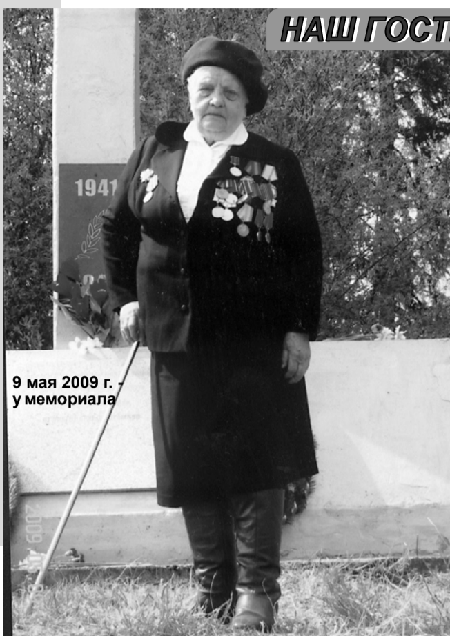
9 мая 2009 г. у мемориала

Наличие партизанского края облегчило действия Красной Армии при освобождении района в начале 1944 года. Мы все так радовались, когда ненавистного врага прогнали с родной земли! И почти сразу Вы приступили к работе в школе? До войны, после училища, я успела немного поработать в Высокотской школе и год была заведующей Заовражской начальной школы. А после освобождения района от немецких захватчиков с 15 мар-