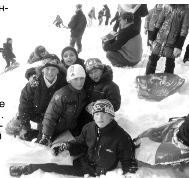
Фото и текст В.ГАЛКИНОЙ.

Завершился праздник Широкой Масленицы сжиганием чучел. Их дети приготовили заранее на специальном уроке, где много узнали об этом народном празднике. Вернулись горожане домой под вечер – в хорошем настроении и с незабываемыми впечатлениями. А материалы творческого объединения пополнятся новыми снимками.