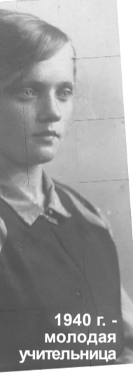
1940 г. – молодая учительница

Очень ценю и другую награду – орден Октябрьской революции: его получила в 1973 году – в соответствии с Указом Президиума Верховного Совета СССР. А в 1985 году была награждена орденом Отечественной войны II степени. Но не менее дороги и медаль «За оборону Ленинграда», и памятный знак «Ленинградский партизан», и юбилейные медали в честь Победы в Великой Отечественной войне: они, как вехи в моей судьбе, которая не отделима от судьбы тысяч моих земляков, от судьбы страны.