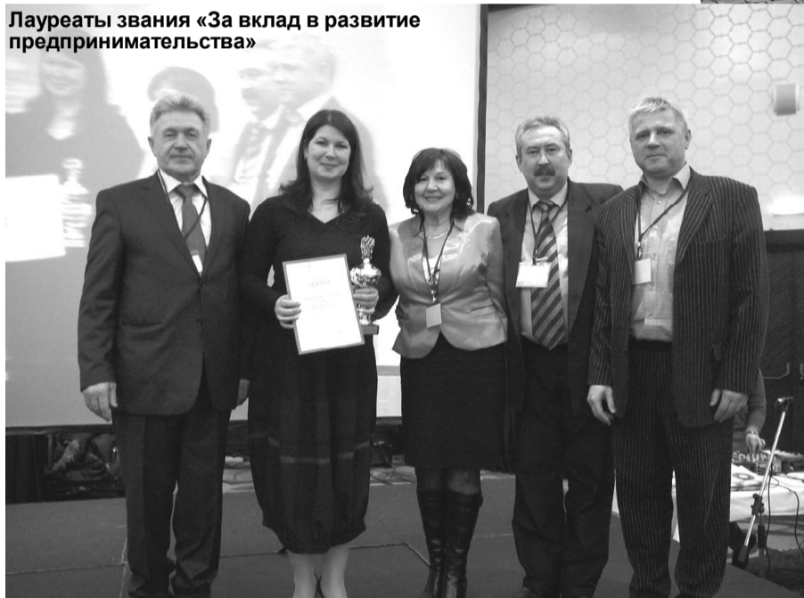
Лауреаты звания «За вклад в развитие предпринимательства»

в его пользу и задача для бизнес-сообщества – объединение для защиты своих интересов. Возможно, нам нужен общероссийский общественно-экспертный совет предпринимателей.