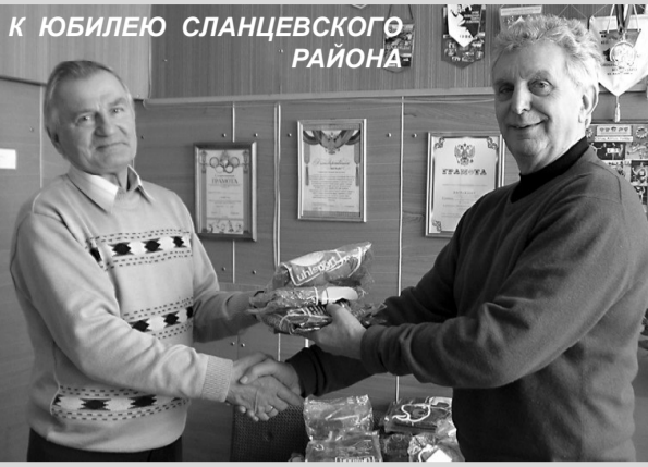
К ЮБИЛЕЮ СЛАНЦЕВСКОГО РАЙОНА