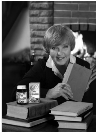
Народная артистка СССР АДА РОГОВЦЕВА

Улучшенная формула по качественному составу бальзама превосходит предыдущие аналоги.