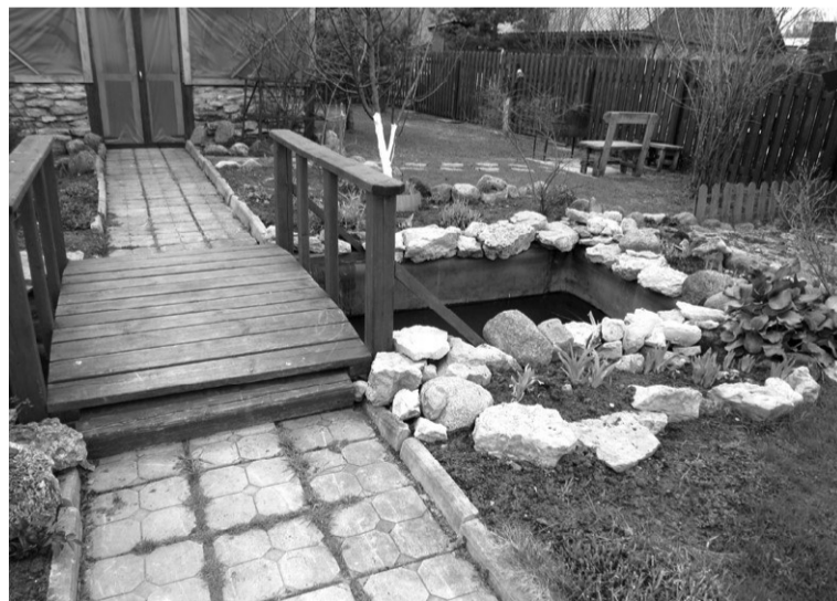
Фото и текст В.ГАЛКИНОЙ.

В предстоящие выходные в «Шахтёре», как всегда, будетлюдно и шумно! К слову, почти все участки у дачников приватизированы, в аренде — единицы. Значит, люди основательно думают о будущем своём, своих детей и этих прекрасных мест. Может, и название к тому времени новоиспеченной деревеньке найдётся?