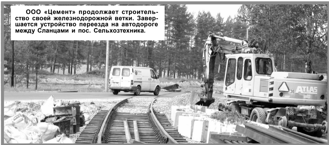
ООО «Цемент» продолжает строительство своей железнодорожной ветки. Завершается устройство переезда на автодороге между Сланцами и пос. Сельхозтехника.

Объявлен конкурс на право заключения договора аренды тепловых сетей.