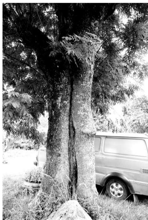
участки как следует.

Года два назад в Березняке появилось фермерское хозяйство, главой которого является довольно молодой человек. По возрасту он относится к тем категориям населения, кто может рассчитывать на поддержку за счёт средств бюджета. Вот и этим фермерам помогли, но вернуть ссуду они не суме-