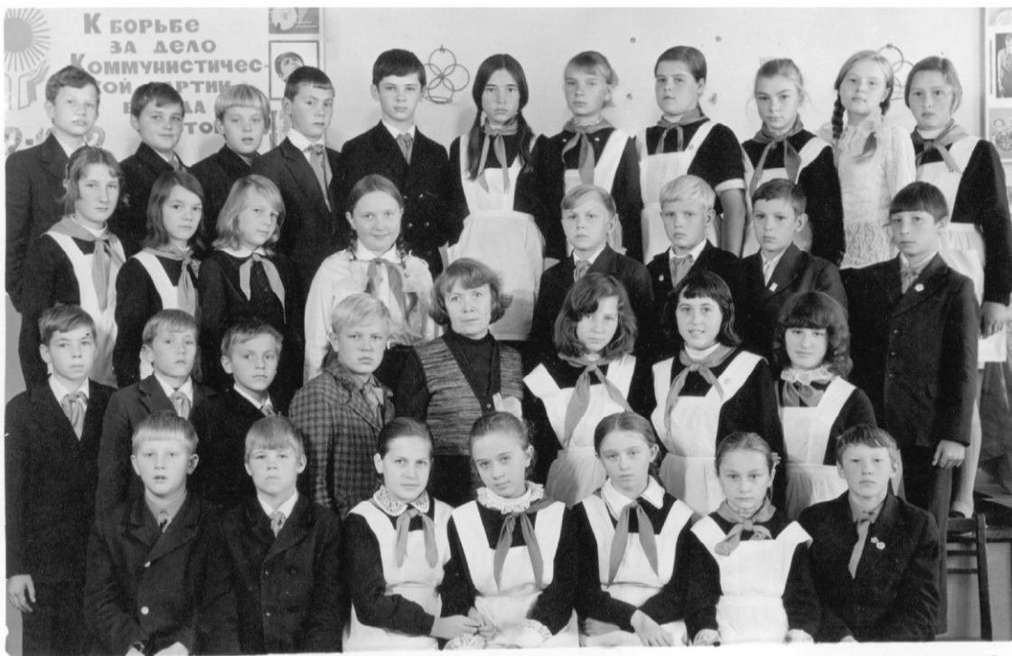
1975 - 1976 Средняя Школа №1 Сланцевская