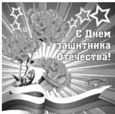
С Днем защитника Отечества!

желаем крепкого здоровья, благополучия, хорошего настроения и мирного неба над головой!