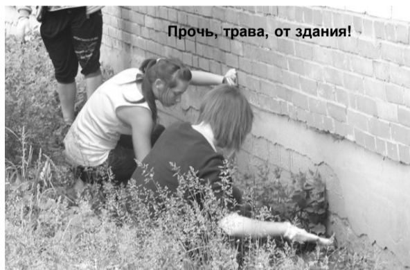
Прочь, трава, от здания!

«Я второй год в трудовом лагере, попал сюда совершенно добровольно. В прошлом году тоже был в этом лагере, только в другой школе. Живём одни с мамой, и я рад, что смог поработать. В прошлом году на зарплату, полученную здесь, купил себе одежду. Теперь хотелось бы купить компьютер... Спасибо, что повысили заработную плату», «Полдня мы работаем, полдня отдыхаем. Развлекаемся в основном на спортивной площадке школы и в спортивном зале. Нам не хватает спортивного инвентаря: есть один старый баскетбольный мяч и старый футбольный. Есть шахматы, но в них нет коня и двух пешек. Бадминтона нет, арабского мячика для игры в лапту. А я вообще-то футбольный вратарь».