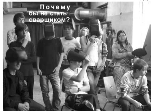
Почему бы не стать сварщиком?