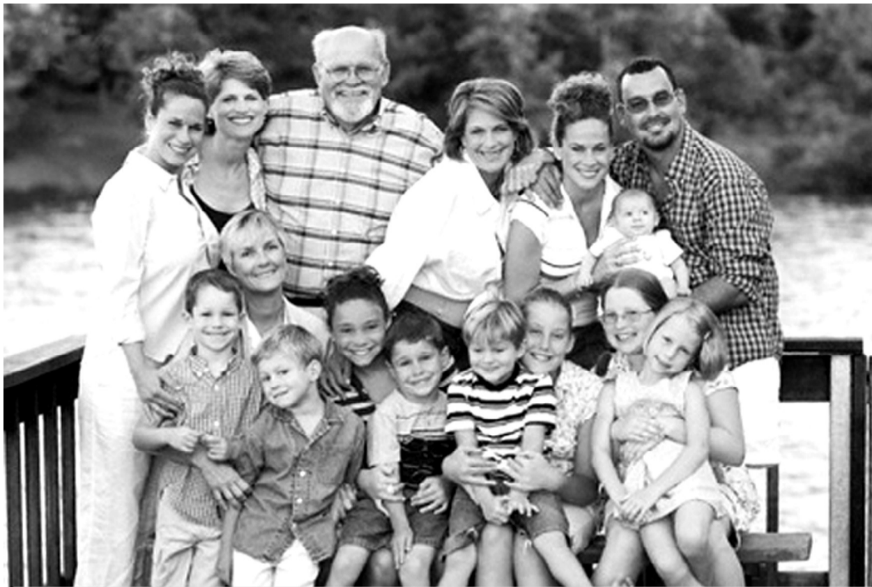
Здоровье женского сердца зависит от количества домочадцев

Сейчас средний возраст первородящих женщин в России - 28 лет, тогда как в сере-