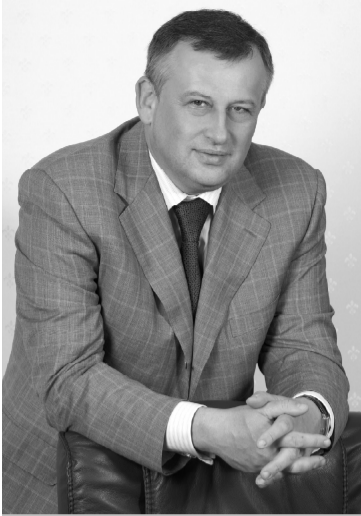
«Уверен, что ЛГУ имени А.С.Пушкина не только сохранит, но и существенно укрепит свои позиции, а его выпускники своими достижениями будут способствовать дальнейшему динамичному развитию нашего региона», - сказал губернатор Александр Дрозденко в связи с 20-летием ЛГУ им.А.С.Пушкина.