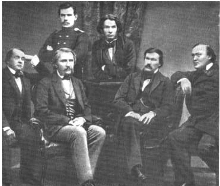
Группа писателей – сотрудников журнала «Современник». Стоят: Л.Толстой, Григорович. Сидят: Гончаров, Тургенев, Дружинин, Островский. 1856.