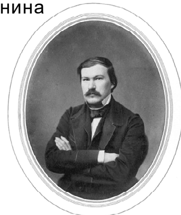
А.В.ДРУЖИНИН. 1824-1864. Фотография 1856.

Что ждет меня и всех нас ровно через год, 31 дек<абр>я 1855 года? (О Крымской войне - В.Б.) Много ли еще бед наделают шуцера Минье и не прекратится ли убийство хорошего и славного народа? Не придется ли нам быть зрителями великих зрелищ и бранной эпохи? Сбережем ли мы всех друзей наших и самих себя? Не кончится ли вся эта кровавая история благополучным миром? Поймут ли люди, наконец, что на свете и без войны жить довольно трудно, а с войною для многих невыносимо? Но