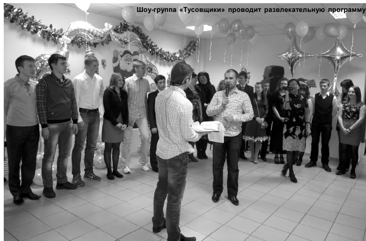
Шоу-группа «Тусовщики» проводит развлекательную программу