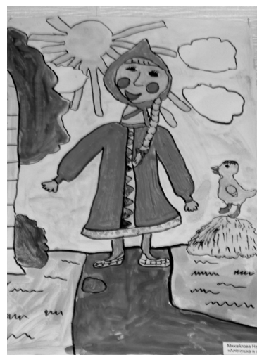
К праздникам в театре кукол открылась выставка работ ребят по любимым спектаклям

Надо было видеть, с каким энтузиазмом, азартом работали дети с этими куклами. С точки зрения актёрского мастерства им было интересно вживаться в роли забавных сказочных героев.