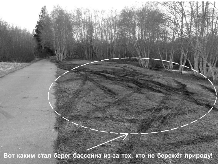
Вот каким стал берег бассейна из-за тех, кто не бережёт природу!