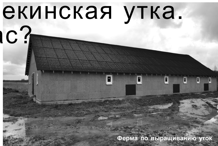
Ферма по выращиванию уток

Самым интересным во встрече стало выступление кингисеппского фермера Л.В.Гячене. В 2012 году Любовь Васильевна стала обладателем гранта в размере 1 млн 750 тыс. рублей на создание хозяйства по выращиванию пекинской утки. Особенностью этого вида птицы является достаточно короткий цикл выращивания и наличие спроса на рынке сбыта. На сегодняшний день у фермера построены помещения для выращивания птицы, приобретен транспорт, благоустроены подъездные пути к объекту. Идет подключение к электричеству. Выращена первая партия уток в 50 штук. Л.В.Гячене : "Средства в виде гранта стали для меня весомой поддержкой в налаживании бизнеса. Они являются большим стимулом для развития. Согласитесь, что не каждый бизнесмен решится вложить такие суммы личных средств в то или иное дело. А здесь государство помогает "встать на ноги". Поэтому советую всем начинающим фермерам воспользоваться возможностью получить средства. Не скажу, что в таком виде бизнеса, как птицеводство, для меня все складывалось и складывается гладко,