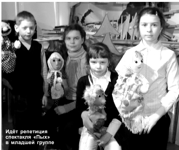
Идёт репетиция спектакля «Пых» в младшей группе