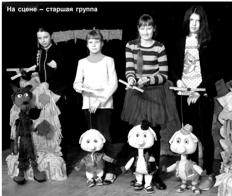
На сцене — старшая группа

Материалы полосы подготовила Валентина ГОРДЕЕВА.