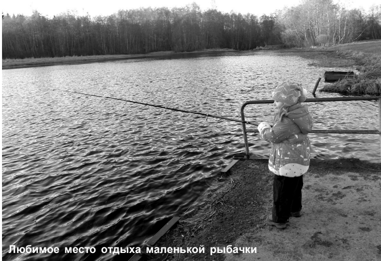
Любимое место отдыха маленькой рыбачки

В.П.Егоров: «Я живу в Лучках уже лет 30. Это мой родной микрорайон. Помню, каким парк был раньше. В нём проходили все городские массовые мероприятия, была танцплощадка, стояло колесо обозрения. А какие замечательные цветы цвели на клумбах. Всюду стояли скамейки для отдыха. Бассейн тоже был ухоженным, к купальному сезону его всегда чистили. На зелёной траве загорали