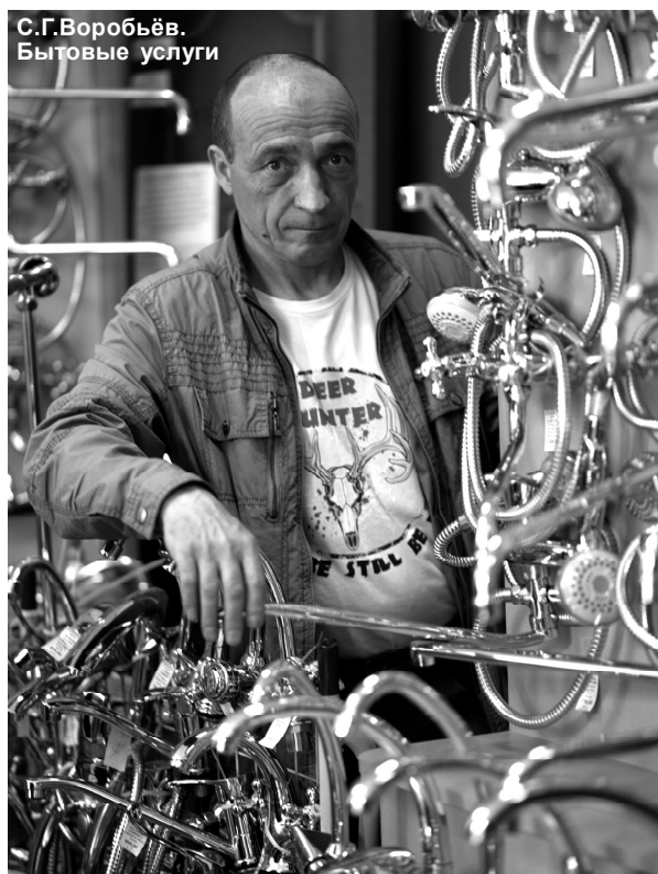
С.Г.Воробьев. Бытовые услуги