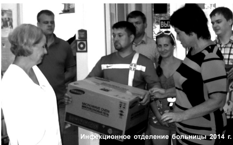
Инфекционное отделение больницы 2014 г.