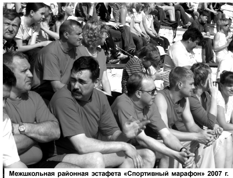
Межшкольная районная эстафета «Спортивный марафон» 2007 г.

А добрые дела под официальным названием акция «Малый бизнес-детям!» продолжилась... Самое время обратиться к истории.