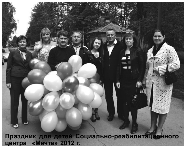
Праздник для детей Социально-реабилитационного центра «Мечта» 2012 г.