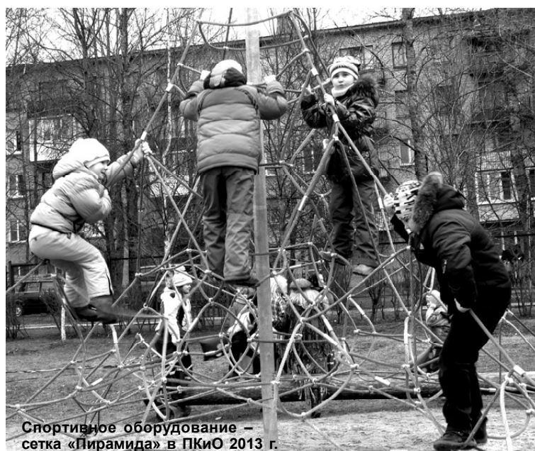
Спортивное оборудование - сетка «Пирамида» в ПКЮ 2013 г.