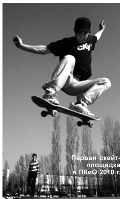
Первая скейт-площадка в ПКЮ 2010 г.