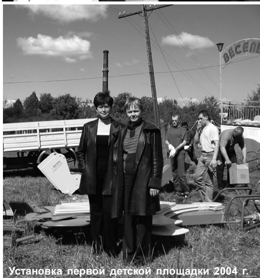
Установка первой детской площадки 2004 г.