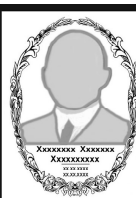
ФОТО на эмали

Грузоперевозки Газель 17 м³. Фургон. 1,5 тонн. Любые направления. Т.33-686, 8-921-920-12-53.