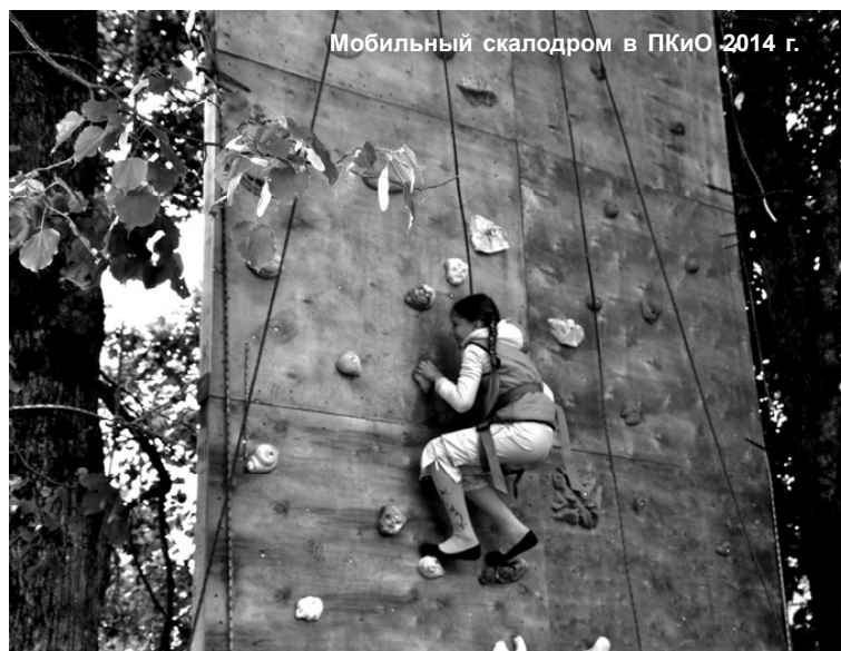
Мобильный скалодром в ПКЮ 2014 г.