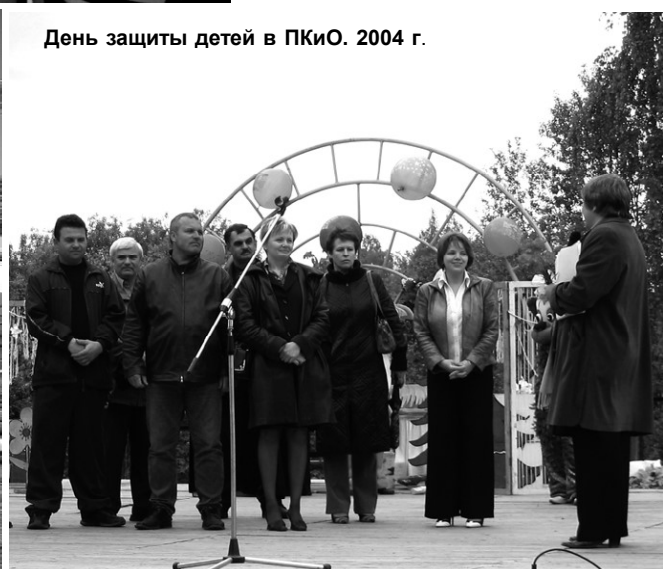
День защиты детей в ПКЮ. 2004 г.