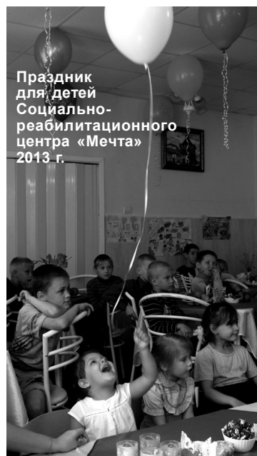
Праздник для детей Социально-реабилитационного центра «Мечта» 2013 г.