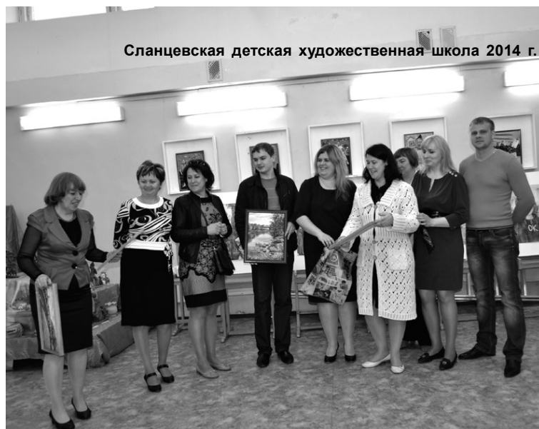
Сланцевская детская художественная школа 2014 г.