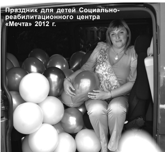
Праздник для детей Социально-реабилитационного центра «Мечта» 2012 г.