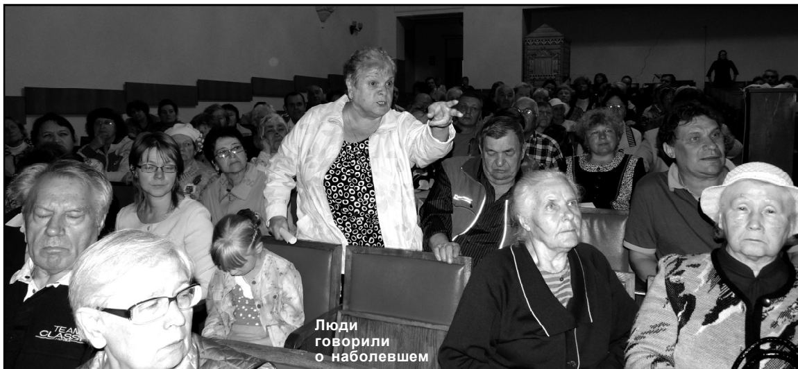
Люди говорили о наблевшем

"В Сланцах есть реальные проблемы с жилищным фондом, которые необходимо решать администрации и несколько более активно и с реальным результатом, по-