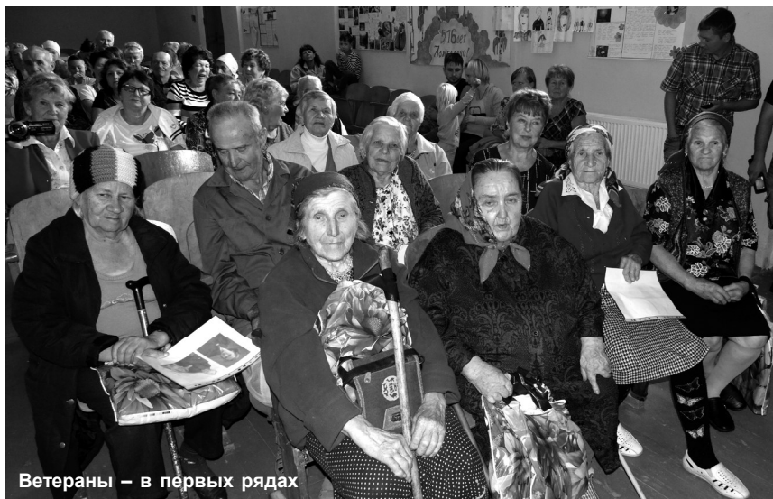
Ветераны – в первых рядах