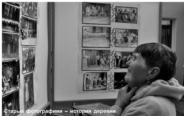
Старые фотографии – история деревни

ли праздник выступления танцевальных групп из Домов культуры Вискатки и Старополья. Не мешало зрителям и гостям праздника небо, периодически грозившее пролиться дождём. Малыши резвились на батуте, предоставленном городским парком, желающие могли прокатиться на лошадке. Внимание взрослых также привлекали торговые ряды.