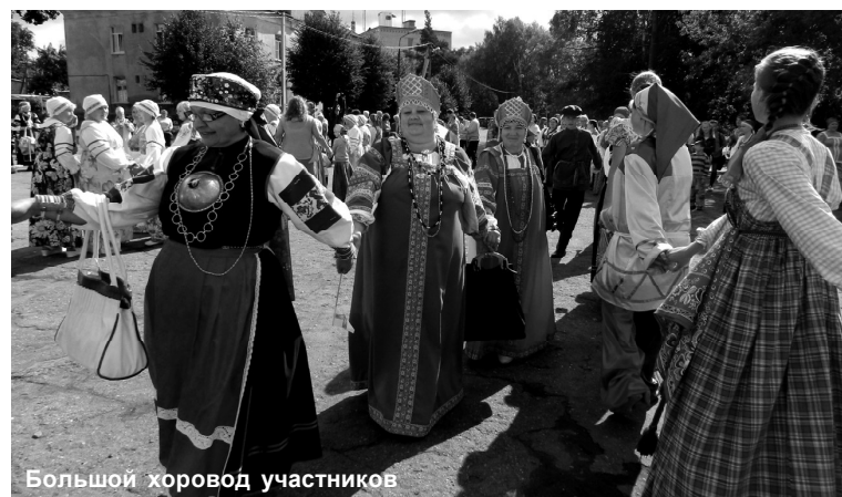
Материалы полосы подготовила Наталья СТЕПАНЕНКО.

В фестивале "Гдовская старина" приняли участие 17 коллективов, которые приехали из Псковской, Ленинградской областей, Белоруссии, а также ансамбль "Сето" – из Эстонской республики. Тепло и радушно принимали организаторы фестиваля каждый коллектив. Было организовано шествие по улице старинного Гдова, затем состоялись концерты на "малых" концертных площадках и гала-концерт на центральной площади города. Благодаря самобытности каждого коллектива фестиваль получился ярким, добрым и запоминающимся.