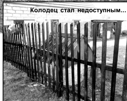
Колодец стал недоступным...