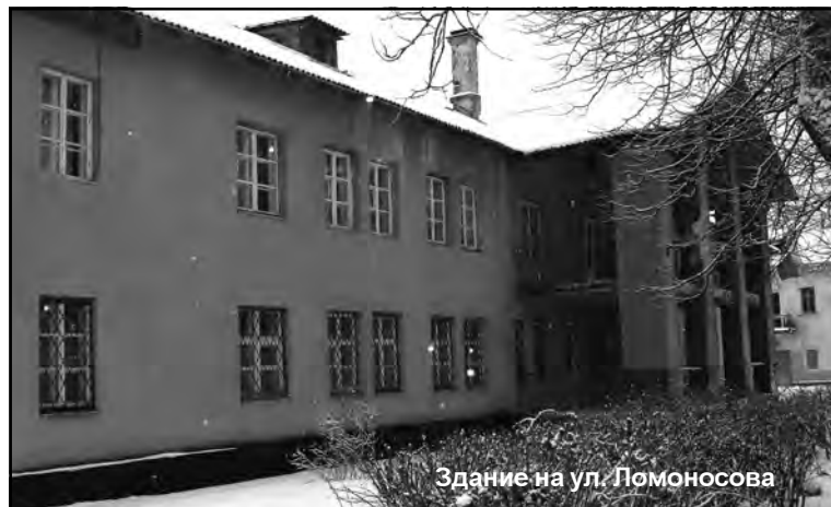
Здание на ул. Ломоносова