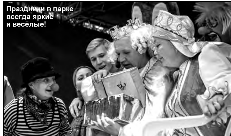
Праздники в парке всегда яркие и весёлые!

Сегодня парк культуры и отдыха стал популярным и любимым местом отдыха у сланцевчан. И его коллектив старается максимально использовать природные возможности парка, организует круглогодично мероприятия на открытом воздухе, чтобы горожане проводили своё свободное время интересно и с пользой для здоровья. Для этих целей в зимнее время в парке прокладываются лыжня, заливаются 2 катка, традиционно проводятся народные гулянья, посвященные новогодним и рождественским праздникам, широкой Масленице. В формате этих праздников организуются культурно-развлекательные и игровые программы. На эти темы мы и беседуем с директором парка С.П.БАРАНОВЫМ.