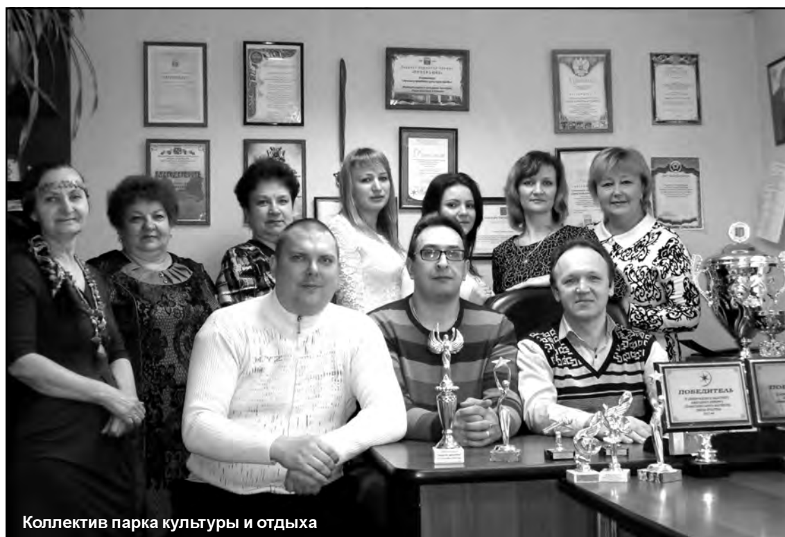
Коллектив парка культуры и отдыха

- Ещё как повезло! У нас нет случайных людей. Каждый ответственно подходит к любому порученному делу, а поэтому