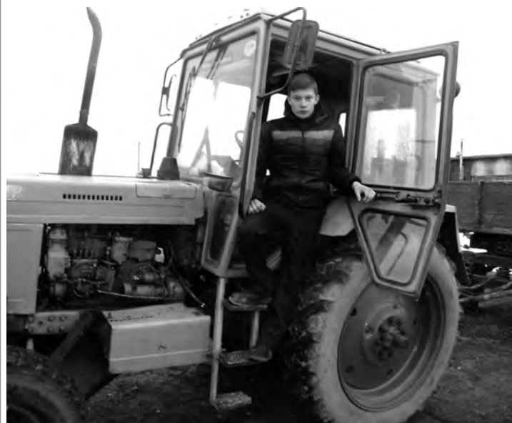
Материалы полосы подготовили Наталья СТЕПАНЕНКО и Татьяна КРЫЛОВА.

Конкурс профмастерства пройдёт также среди студентов 2 курса. Из призёров будут выбраны участники областного конкурса профессионального мастерства.