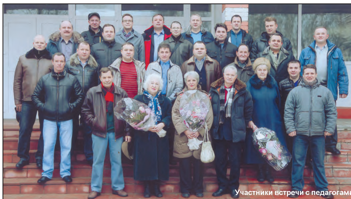
Участники встречи с педагогами

пришлось пережить, но они нашли своё место в жизни, состоялись как профессионалы.