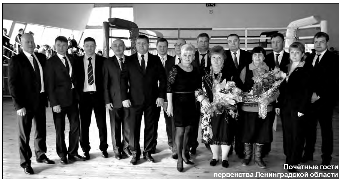
Почётные гости первенства Ленинградской области

Четыре года назад в нашем городе был открыт клуб бокса имени С.В.Мальченко. Он оснащён современным оборудованием, созданы все условия для тренировок юных боксёров. И не только для тренировок, но и для проведения крупных соревнований: 13-15 марта в сланцевском клубе бокса прошло первенство Ленобласти. Такие значимые региональные состязания проходят в нашем городе уже второй раз – впервые областное первенство по боксу проводилось в Сланцах в марте 2013 года.