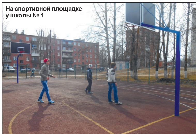
На спортивной площадке у школы № 1