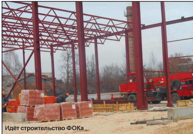
Идёт строительство ФОКа