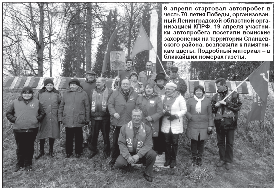
8 апреля стартовал автопробег в честь 70-летия Победы, организованный Ленинградской областной организацией КПРФ. 19 апреля участники автопробега посетили воинские захоронения на территории Сланцевского района, возложили к памятникам цветы. Подробный материал – в ближайших номерах газеты.

Сланцевский муниципальный район Ленинградской области