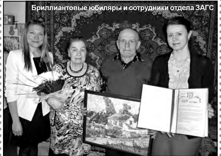
Бриллиантовые юбиляры и сотрудники отдела ЗАГС