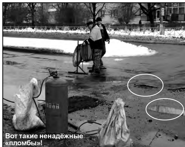
Вот такие ненадёжные «пломбы»!