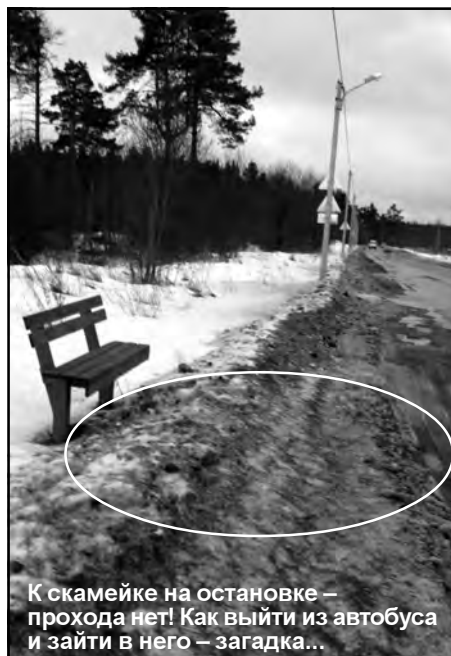
К скамейке на остановке – прохода нет! Как выйти из автобуса и зайти в него – загадка...

Снегопад доставил дорожным рабочим хлопот. Но, судя по количеству огромных снежных навалов по обочинам дорог, к своей работе по очистке городской территории от снега они отнеслись недобросовестно.