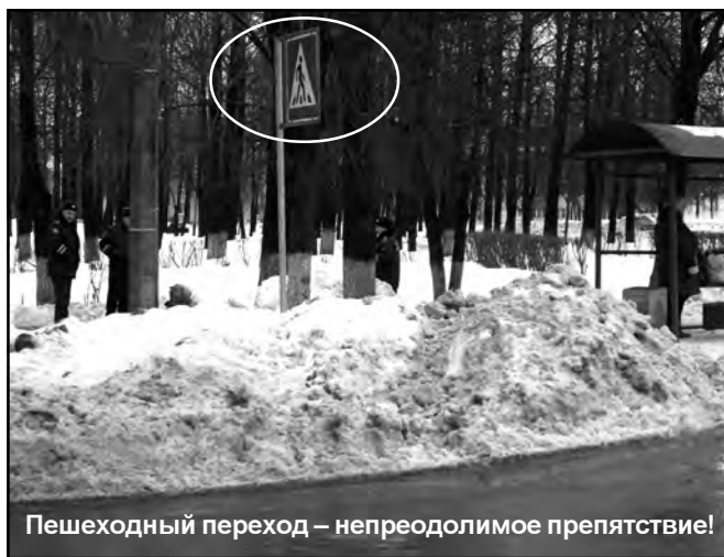
Пешеходный переход – непреодолимое препятствие!