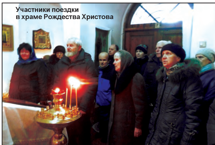
Участники поездки в храме Рождества Христова

11 января мы совершили поездку в Псков. Благодаря экскурсоводу, узнали интересную и богатейшую историю г.Пскова и его Кремля.