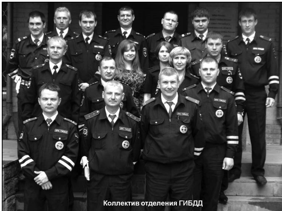
Коллектив отделения ГИБДД

- Та работа, которую мы постоянно проводим по пропаганде безопасности дорожного движения, представляет сегодня целенаправленную деятельность по распространению знаний, касающихся вопросов обеспечения безопасности дорожного движения, разъяснению законодательных и иных нормативных актов, по укреплению авторитета и доверия среди жителей города к деятельности Госавтоинспекции. Мы проводим работу по привлечению широких масс населения, особенно школьников, к проблемам обеспечения безопасности дорожного движения.