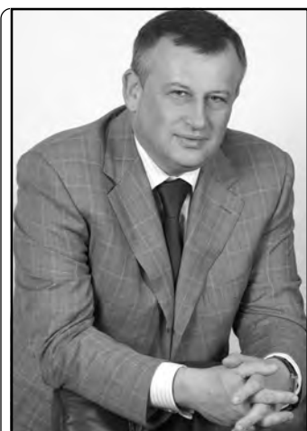
кадров», — сказал врио губернатора Ленинградской области Александр Дрозденко, принимая участие в Киришах в медицинском форуме.

«Очень приятно, что наша программа привлечения медицинских кадров начала работать, поскольку многое здесь зависит от заинтересованности районной власти в софинансировании. Взять хотя бы Лугу, которая была в самых отстающих районах, а после определенных кадровых действий, за два года привлекла 56 специалистов разных профилей и вышла в лидеры по обеспеченности медицинскими кадрами во всей Ленинградской области. Без служебного жилья, которое не может быть приватизировано первые 10 лет, мы не решим проблему врачебных кадров» , — сказал врио губернатора Ленинградской области Александр Дрозденко, принимая участие в Киришах в медицинском форуме.