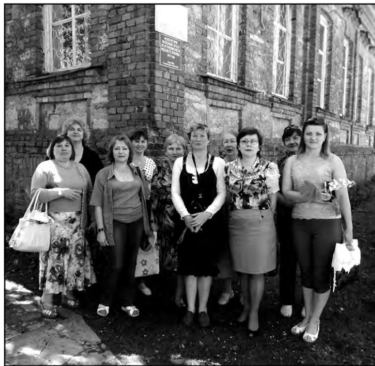
требована у посетителей. Цель – показать сельским библиотекарям методику создания вы-

Важно для внедрения новых форм работы, поиска идей и практик для привлечения к книге и чтению сельских жителей обмен опытом с другими библиотеками. На выездных семинарах мы знакомимся с модельными сельскими библиотеками Гдовского района и краеведческой работой Кингисеппских библиотек. Выезжали сельские библиотекари в Ленинградскую областную детскую библиотеку на семинар «Дети и подростки в библиотеке: идеи для чтения, общения, развития». За помощь в организации транспорта благодарны администрации Сланцевского района. Сейчас у нас есть свой библиобус. И с его появлением выезды в сельские библиотеки будут осу-