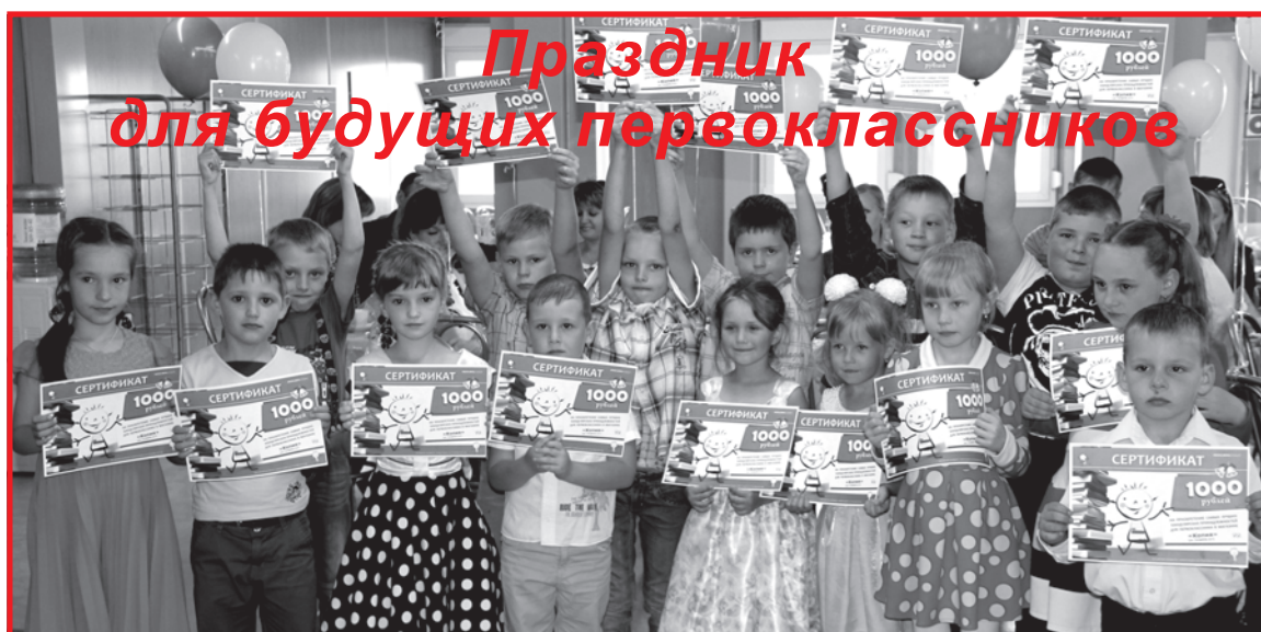
Праздник для будущих первоклассников

Сланцевский муниципальный район Ленинградской области