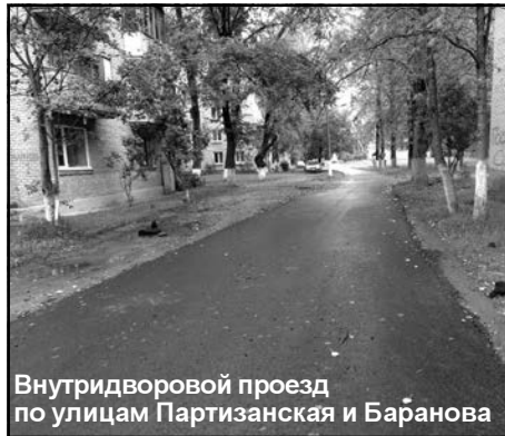
Внутридворовой проезд по улицам Партизанская и Баранова