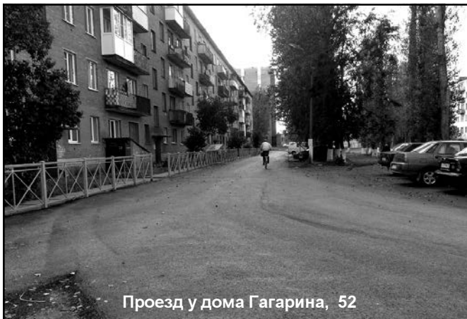
Проезд у дома Гагарина, 52