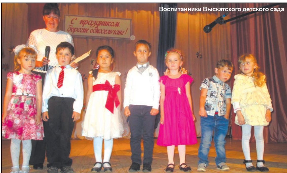
Воспитанники Выскатского детского сада