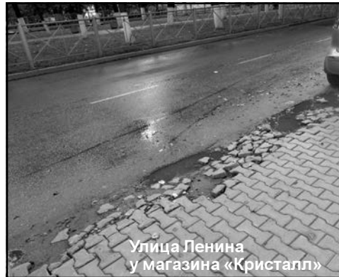
Улица Ленина у магазина «Кристалл»