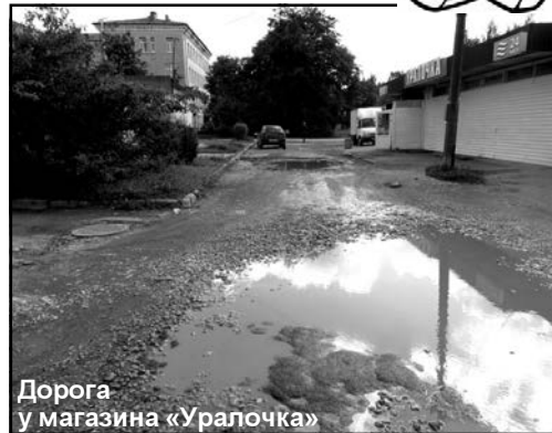
Дорога у магазина «Уралочка»