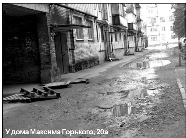
У дома Максима Горького, 20а