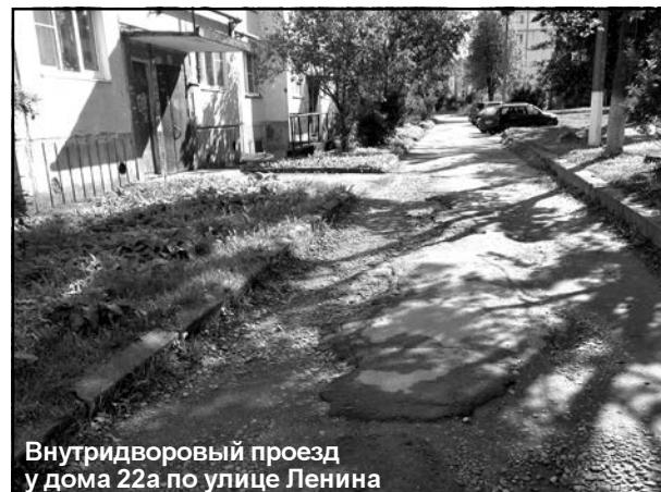
Внутридворовой проезд у дома 22а по улице Ленина

Кому нравятся плохие дороги? – Да, никому! По колдобинам не только ездить неудобно, но главное – опасно! Дороги ремонтируют, но как?