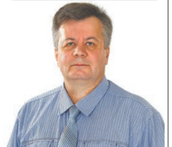
Ай да Путин...

Начало уходящей недели, несомненно, отмечено мировым политическим оживлением. А повод... «Владимир Путин вернулся в ООН после десятилетнего отсутствия, и одним махом забил три победы. Он «нокаутировал» Барака Обаму, завоевав внимание Генеральной Ассамблеи ООН и вернул России статус великой державы», - пишет итальянское издание Il Giornale.