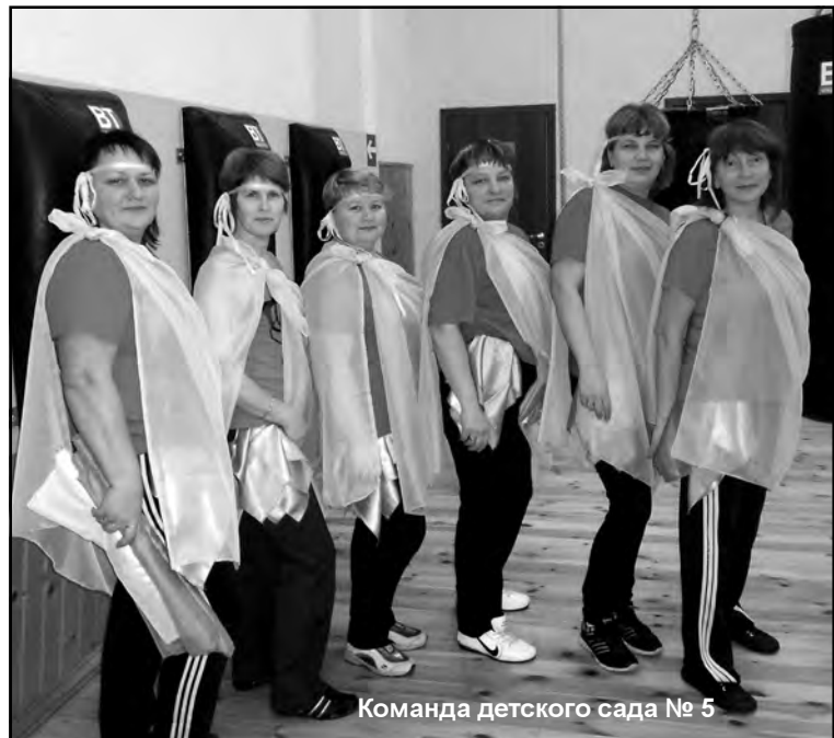
Команда детского сада № 5

В четверг, 29 октября, в здании клуба бокса им. С.В. Мальченко, состоялось открытие VI спартакиады педагогических работников Сланцевского района 2015-2016 учебного года. В этом году тринадцать образовательных учреждений будут участвовать в спортивной борьбе, за право стать победителем районной спартакиады: команды школ №№ 1, 2, 3, 6, детских садов №№ 1, 3, 4, 5, 7, 10, 11, 15, 22.