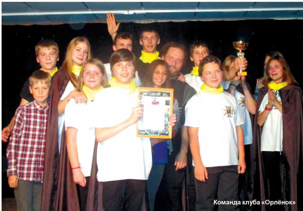
Команда клуба «Орлёнок»