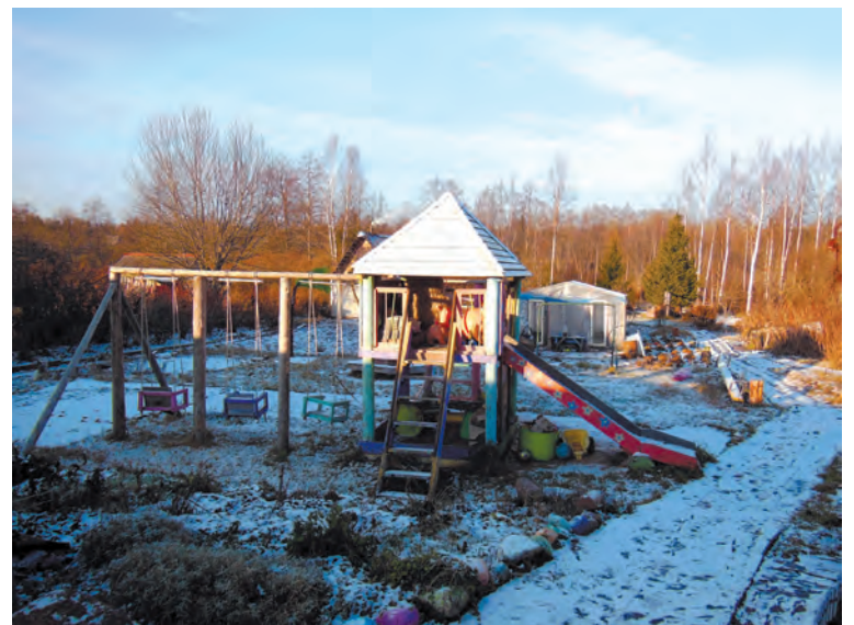
Фото и текст Аллы ГУСАРОВОЙ.