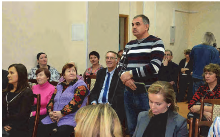
Фото и текст Натальи СТЕПАНЕНКО.

Председатель комитета по культуре, спорту и молодёжной политике администрации Д.А. Подольский предложил рассмотреть возможность реализации малобюджетного проекта по строительству в нашем городе открытого катка с искусственным льдом.