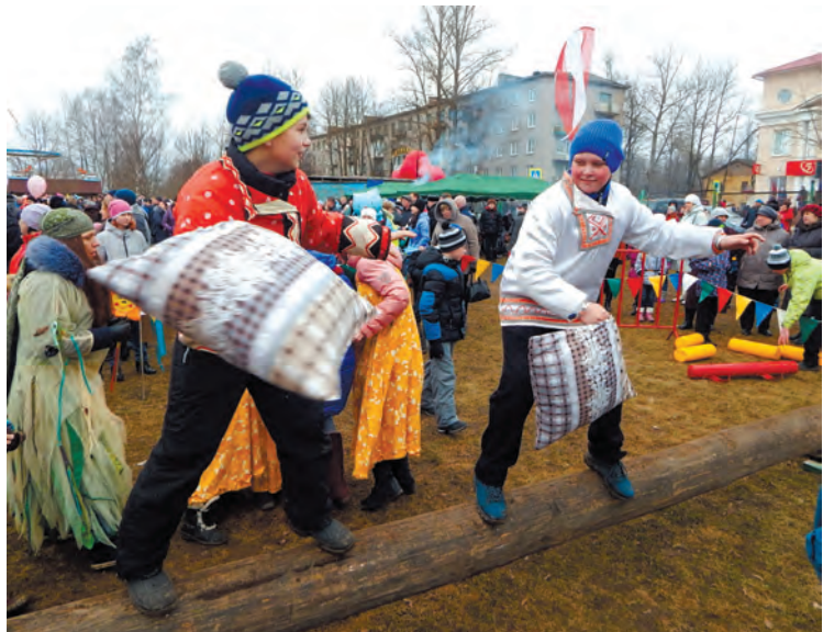
Фото и текст Валентины ГОРДЕЕВОЙ.

Праздник не был бы таким замечательным, если б в нём не приняли участие спонсоры: депутат Законодательного собрания Ленинградской области В.С.Петров, ООО «Петербургская керамика», индивидуальные предприниматели Д.Михайлов окна «Аркадия», А.Е.Семёнов, ЗАО «Ареоль» (Н.Д.Михайлова), И.С.Богданова (магазин «Родник»), магазин «Империya дверей».