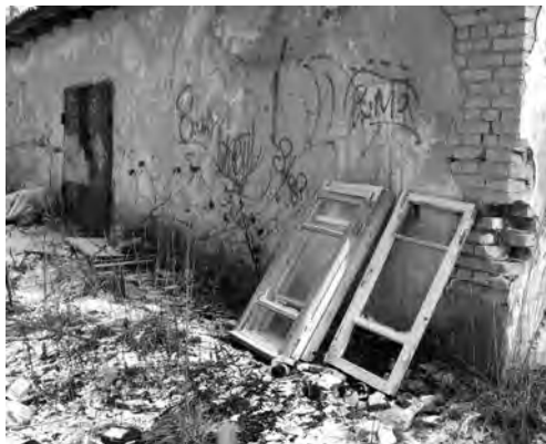
Фото и текст Натальи СТЕПАНЕНКО.

Возвращаясь к теме грядущих субботников, хочется, чтобы обратили внимание на территорию возле железнодорожного вокзала. За зданием общественного туалета – мусорная свалка. Городу, в котором идёт подготовка к празднованию Дня Ленинградской области, наверное, не нужно делить территорию на свою и чужую.