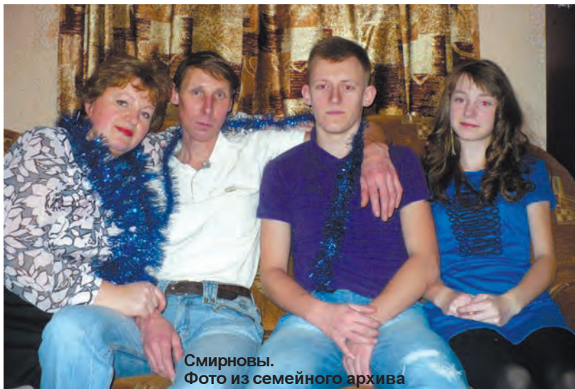
Смирновы. Фото из семейного архива