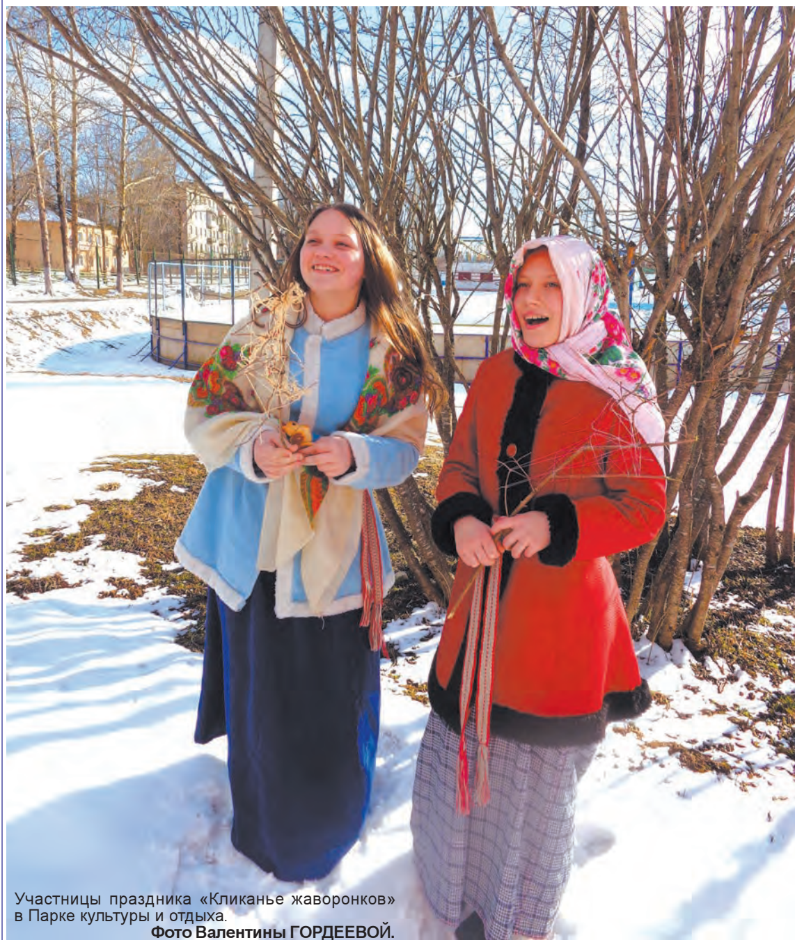
Участницы праздника «Кликанье жаворонков» в Парке культуры и отдыха.

«Жаворонки прилетите, Студёну зиму унесите, Тёплу весну принесите...»