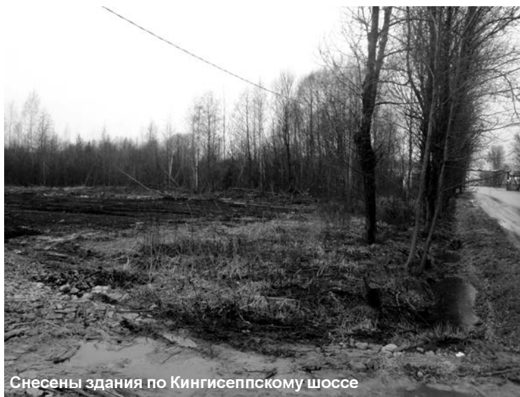
Снесены здания по Кингисеппскому шоссе

вители других субъектов, дипломатического корпуса, руководители крупных предприятий. Губернатором принято решение привести в порядок фасады детской и взрослой поликлиник, стационара, заменить забор вдоль больничного комплекса. На площади Больничного городка гостей будут встречать хозяева праздника. С этого места делегации пройдут по улицам Кирова, Ленина, Спортивная на стадион «Шахтёр», где состоится главная часть праздника. По-