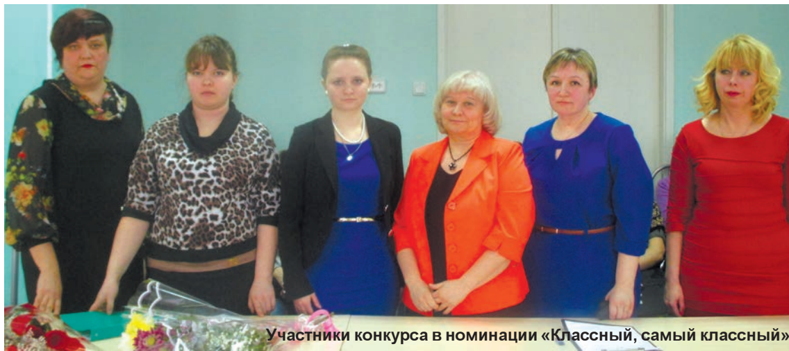
Участники конкурса в номинации «Классный, самый классный»