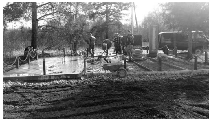
Активно проводится благоустройство воинских захоронений в деревнях Медвежек и Монастырёк.