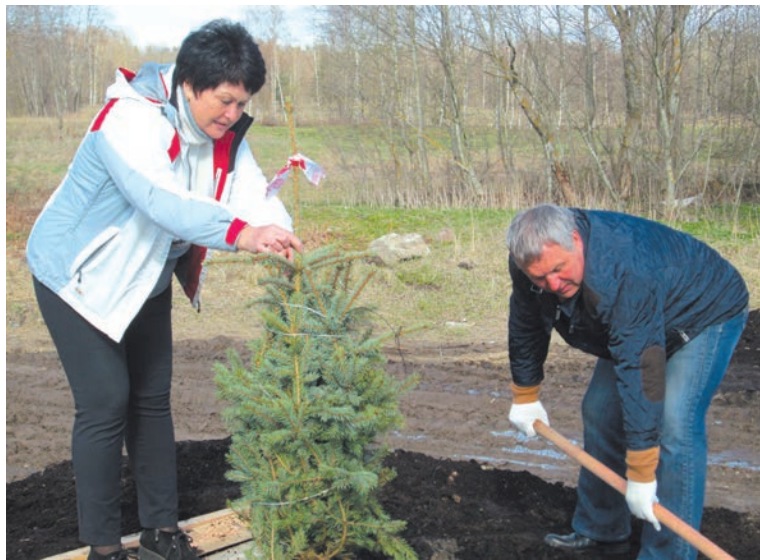
Фото и текст Натальи СТЕПАНЕНКО.

Ели, оставшиеся после посадки на воинском захоронении, высажены у памятников Славы и «Скорбящий воин».