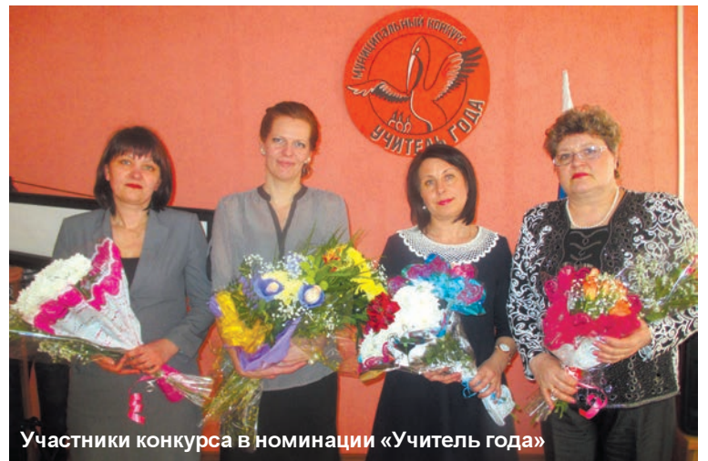
Участники конкурса в номинации «Учитель года»