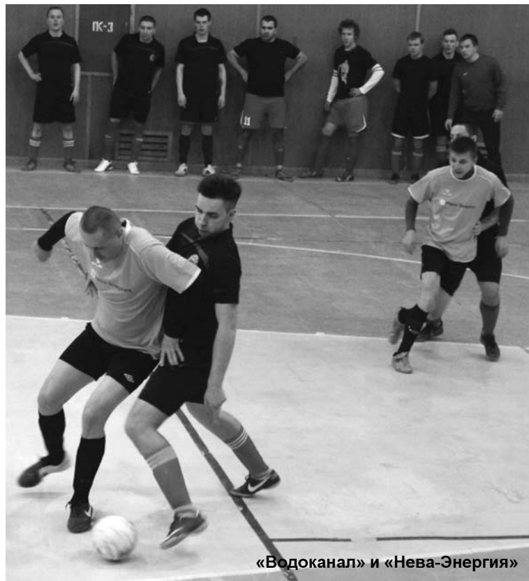
«Водоканал» и «Нева-Энергия»

Второй матч был ещё более результативным. «Химик» кам-