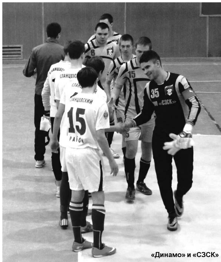
«Динамо» и «СЗСК»

При поддержке администрации Сланцевского муниципального района 9 января на стадионе «Химик» стартовало Первенство Сланцевского района по мини-футболу 2016 года среди мужских команд, в котором принимают участие 12 сборных. Среди них не только опытные команды, которые не первый год выступают на районных мини-футбольных первенствах – команды «Динамо», «Евроаэробетон», «Водоканал», «Лучки», «Нева-Энергия», «СИТ», «ОМВД», «СЗСК», «Химик» и «Цесла», но и совершенно новые команды – «Ветераны» и «Галухин team». И если состав команды «Ветераны» в большинстве своём состоит из опытных футболистов, игравших в составах других команд, то команда «Галухин» – абсолютный новичок соревнований. К сожалению, в этом году не заявлялась на первенство команда «ПетербургЦемент», которая неоднократно выступала на большинстве районных соревнований.