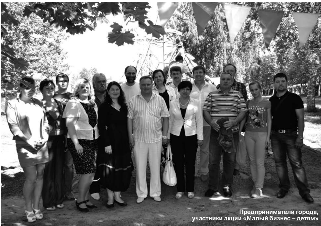
Предприниматели города, участники акции «Малый бизнес – детям»

Мало того, в «Социально-деловом центре» мы регулярно проводим инфодни. Стать их участниками могут не только начинающие предприниматели, но и предприниматели со стажем, любых видов деятельности и направлений. Рассказываем об изменениях в законодательстве, обсуждаем все проблемы, которые возникают. Особенно это актуально, когда новшества законодательства ухудшают положение налогоплательщиков. Представление и защита интересов предпринимателей – одна из важных функций нашей работы. Вырабатываем совместно предложения, отправляем их в Комитет по