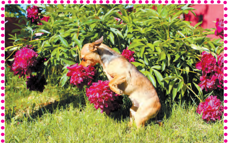
«Нарву цветов я для хозяйки...»