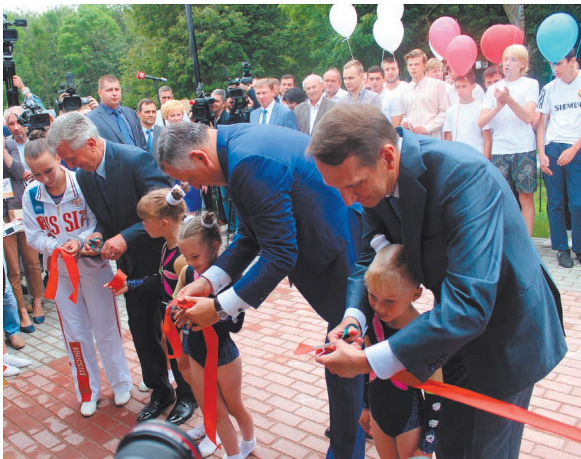
30 июля состоялась торжественная церемония открытия Детской юношеской спортивной школы после капитального ремонта. Материал читайте на стр. 3.

Сланцевский муниципальный район Ленинградской области