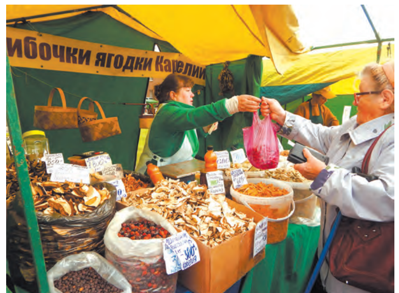
Фото и текст Валентины ГОРДЕЕВОЙ.

Щедрые дары осени, угощения, задорные выступления превратили ярмарку в настоящий праздник. Правда, жителям домов улицы Ленина пришлось немного потерпеть из-за шума и громкой музыки, но ведь ярмарка проходит всего один раз в год.