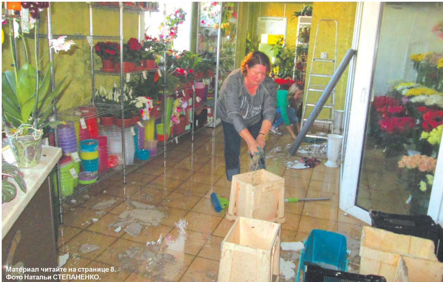
Материал читайте на странице 8.

Уважаемые жители Сланцевского района! Спасибо всем, кто проявил свои лучшие гражданские качества, не остался сторонним наблюдателем важного политического события и пришел 18 сентября на избирательные участки. Приняв участие в выборах депутатов Государственной Думы РФ, Законодательного собрания Ленинградской области, совета депутатов Сланцевского городского поселения, вы подтвердили неравнодушие и заботу о будущем своей малой Родины и страны в целом, желание сохранить стабильность и продолжать движение вперед.