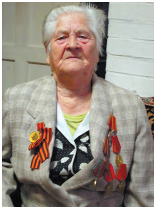
Фото и текст Натальи СТЕПАНЕНКО.

Вот так живёт улица Социалистическая. Обособленно от города. Сохраняя свою историю, но уже начиная писать новую.