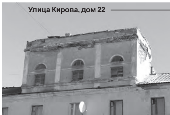
Улица Кирова, дом 22