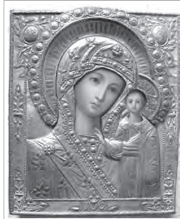
Е.А. Андреев. Образ Казанской иконы Божией Матери в окладе.

1872 года февраля 4 дня в присутствии С.-Петербур. Дух. Конс-и... Приказали: По значительности долга Доложской церкви Свящ. Синоду, кроме