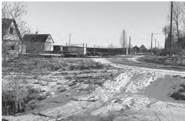
Придёт оттепель – здесь будет море

Надеемся, что в Выскатском сельском поселении услышат эту просьбу и примут меры.