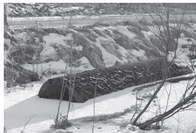
Эта труба должна лежать под дорогой