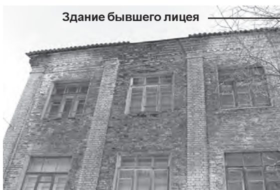
Здание бывшего лица