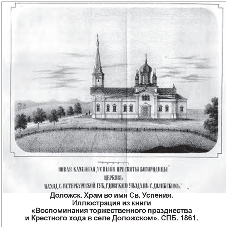
НОВАЯ КАМЕННАЯ УЧЕНИЦА ПРИБУЖИ БОГОРОДИЦЫ ЦЕРКОВЬ УЕЗДА С.-ПЕТЕРБУРГСКОЙ ГУБ., ГДОВСКОГО УЕЗДА С. ДОЛОЖСКОГО. Доложск. Храм во имя Св. Успения. Иллюстрация из книги «Воспоминания торжественного праздника и Крестного хода в селе Доложском». СПб. 1861.

катский 1852 г.» (Германия. Частное собрание); 3. Св. Иоанн и Св. Ап. Иаков (Россия. С.-Петербург. Частное собрание).