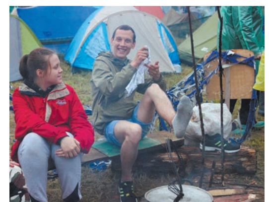
Фото и текст Аллы ГУСАРОВОЙ.