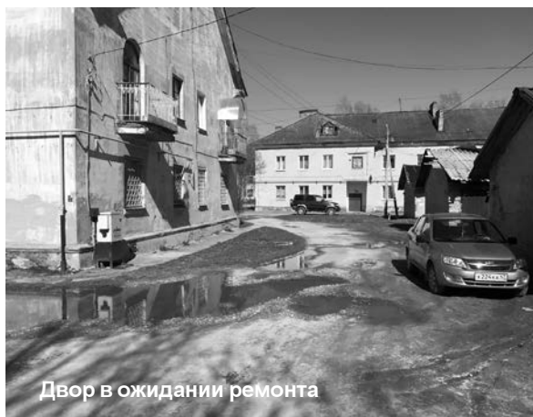
Двор в ожидании ремонта