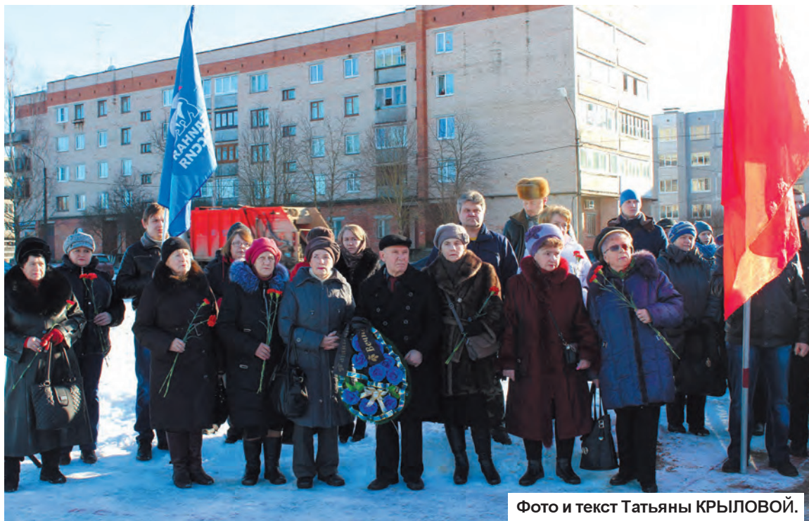
Фото и текст Татьяны КРЫЛОВОЙ.

Пусть никогда больше в скорбном списке погибших в боевых действиях в мирное время не появятся новые имена.