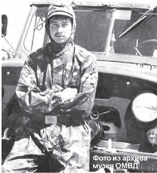
Фото из архива музея ОМВД