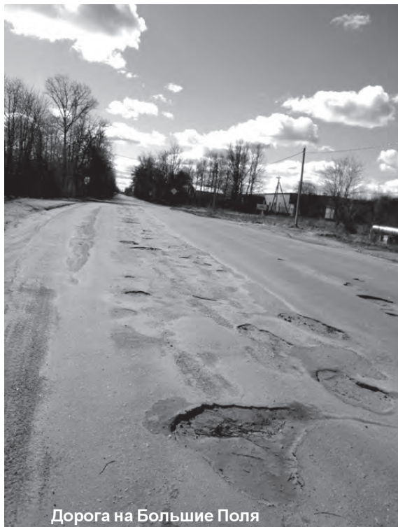
Дорога на Большие Поля

Также запросто, как на мосту, в подобную яму можно угнать в любом дворе города. Один из показательных - дво-