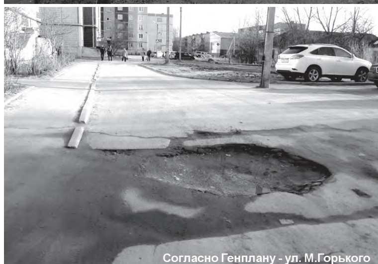
Согласно Генплану - ул. М.Горького

В феврале, на встрече в Городском Доме культуры с представителями практически всех комитетов правительства Ленинградской области, чиновник из дорожного комитета на вопрос из зала: «Будут ли ремонтироваться в этом году дороги в нашем городе?», сделала комплимент нашим дорогам. Ну да, к дорогам на въезде в город претензий нет, хотя изъяны работы дорожников уже проявляются. А по поводу их ремонта водители сочинили грустную шутку: «Дороги ремонтировали ко Дню области. Так ведь на день, а не на год!». Там же, на встрече, однозначно было сказано, что будет отремонтирована дорога Переволок - Кукин Берег. Не оптимистично прозвучали ответы на вопросы о ремонте дорог Сижно-Замощье, Комсомольского шоссе и дороги на ДОК. А именно это - одни из тех