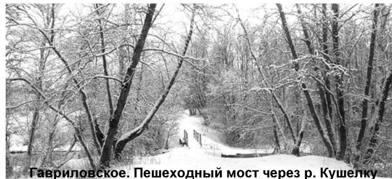
Гавриловское. Пешеходный мост через р. Кушёлку

В 1870-е гг. в Гавриловском чинили и мост через р.Кушёлку, который существует здесь и сегодня. Раньше по этому мосту ездили на телегах и экипажах, теперь же это небольшой пешеходный мостик возле огороженной территории бывшего СПОГАТА. Перед мостом когда-то была дорога, которая имела поворот в имение и к винзаводу, здание которого сохранилось. Это здание в своё время было столовой СПОГАТА, в котором ещё в 1960-е гг. существовал магазин, и в нём традиционно торговали вином и водкой.