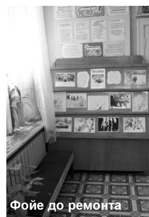
Фойе до ремонта

9 августа 2016 года произошло событие, которого так долго ждали жители нашего города – открытие обновленной библиотеки для детей и взрослых в Лучках (филиала № 2 СЦГБ). Библиотека изменилась полностью. Теперь здесь нет привычных абоне-