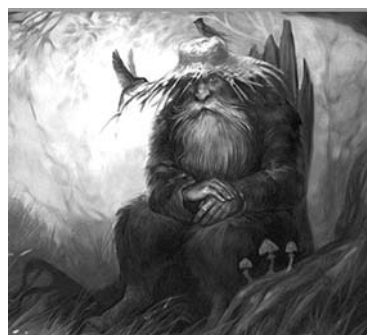
Сам дядюшка Леший – лесной хозяин и повелитель