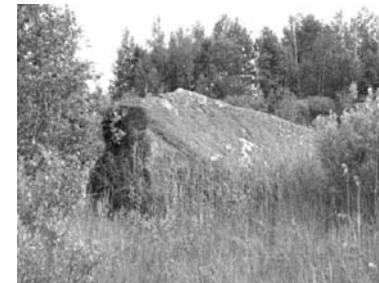
Ленинградская область, Сланцевский район, деревня Подлесье. «Белый камень».

уже не рассказывают. Просто – ну, очень уж он большой.