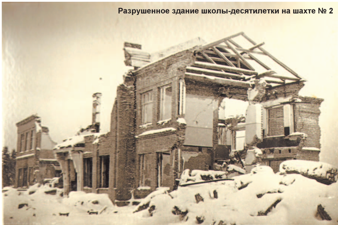
Разрушенное здание школы-десятилетки на шахте № 2

2 февраля – День воинской славы России. Это день разгрома советскими войсками немецко-фашистских войск в Сталинградской битве 1943 году. А для всех жителей Сланцевского района 2 февраля особая дата в истории: был освобождён от захватчиков наш Сланцевский район. Вот таким оставили фашисты после себя наш город.