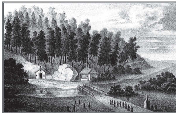
Вид Доложской пещеры в середине XIX века

писью: «Под камнем сим лежат тела усопших «рабов Божиих, Священно-Иереев: Василия и Малахии, и рабынь: Анны и Евдокии. Прохожий, остановись! И над сим прахом смертным – прослезись, Наступит час, когда не будет здесь и нас! Блажен, кто смертный час не забывает, И в вечность свои мысли устремляет».