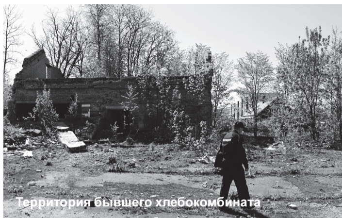
Территория бывшего хлебокомбината