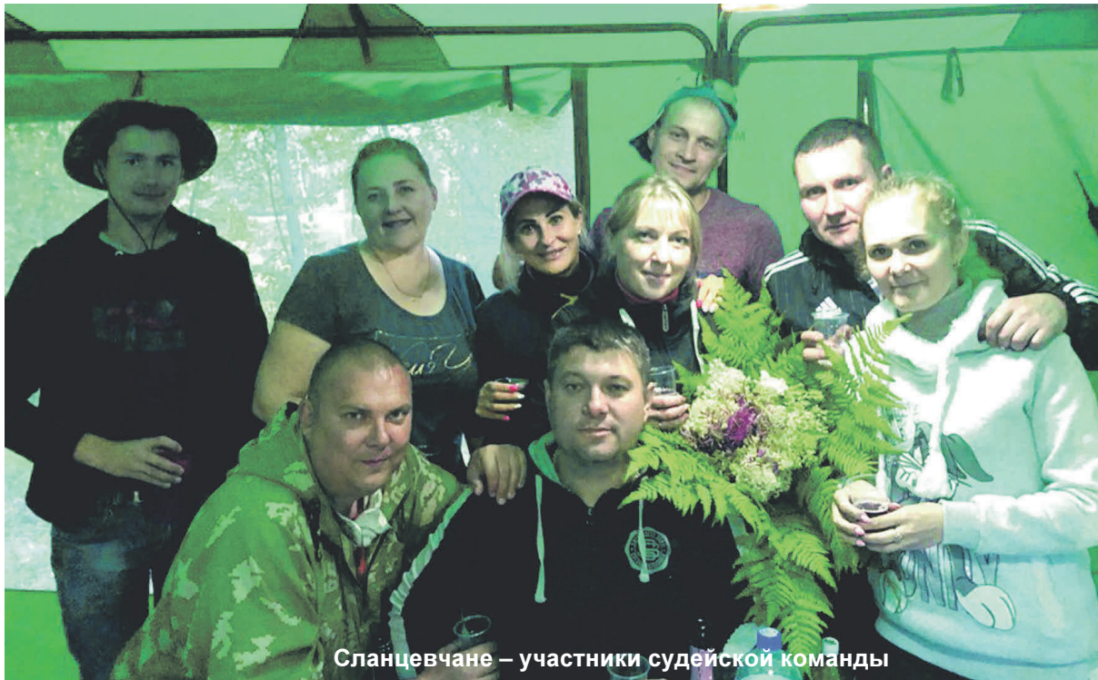
Сланцевчане – участники судейской команды

Лето – любимая пора всех туристов, а особенно тех, что любят палатки, костры, звёздное небо, свежий вольный ветер и дружеское общение на природе. Именно такие туристы – молодые работники предприятий и организаций химического комплекса города Санкт-Петербурга и Ленинградской области вновь собрались в середине июля текущего года на свой традиционный туристский слёт на базе отдыха «Берёзка» ООО «СЛАНЦЫ», на берегу реки Наровы.