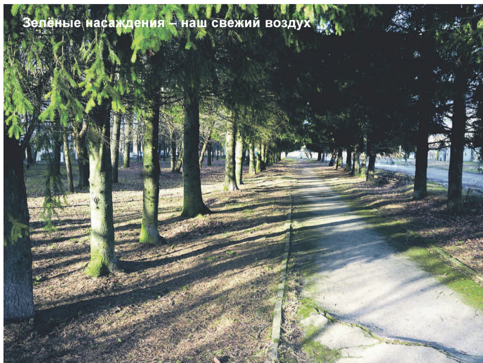
Зелёные насаждения – наш свежий воздух

В последние годы наш город значительно преобразился. Произошла эта «волшебная метаморфоза» во многом благодаря реализации региональной программы «Формирование комфортной городской среды», а также неравнодушным Сланцевчанам, которые любят свой город и заботятся о нём!