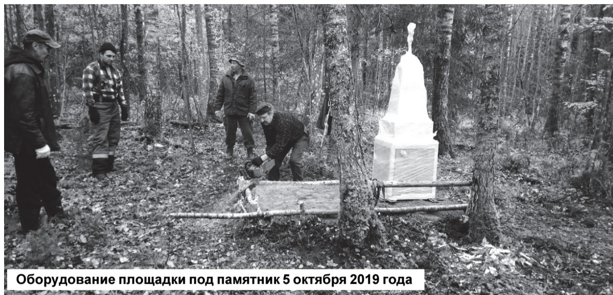
Оборудование площадки под памятник 5 октября 2019 года

Немецкие власти запретили хоронить убитых на кладбище,